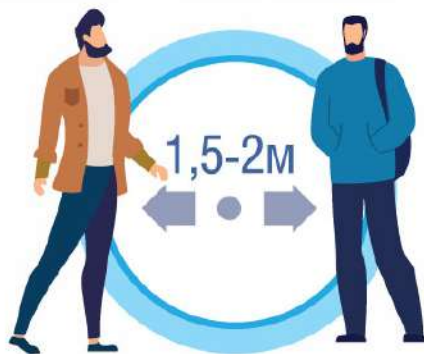
СОБЛЮДАЙТЕ РАССТОЯНИЕ И ЭТИКЕТ