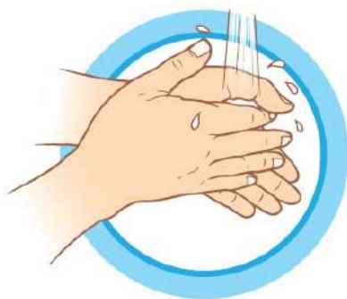
ЧАСТО МОЙТЕ РУКИ С МЫЛОМ