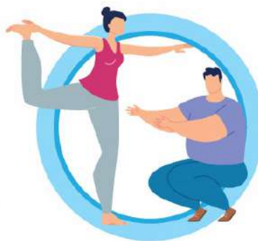
ВЕДИТЕ ЗДОРОВЬЙ ОБРАЗ ЖИЗНИ