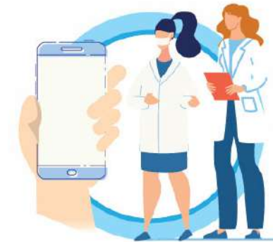
В СЛУЧАЕ ЗАБОЛЕВАНИЯ ОБРАЩАЙТЕСЬ К ВРАЧУ